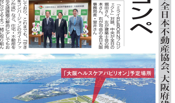
「大阪ヘルスカエアバリオンの予定場所」

万博会場全体イメージと「大阪ヘルスカエアバリオンの開設場所」