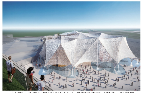
「大阪ヘルスカエアバリオンの外観予想図」

堀田さん 「二瞬の感動」を魅せる「全日本不動産協会、大阪府建築士会」の協働で、1月から始動される。 大阪ヘルスカエアバリオンの出展参加者として認定された。ミライを魅せる「全日本不動産協会、大阪府建築士会」の協働で、1月から始動される。